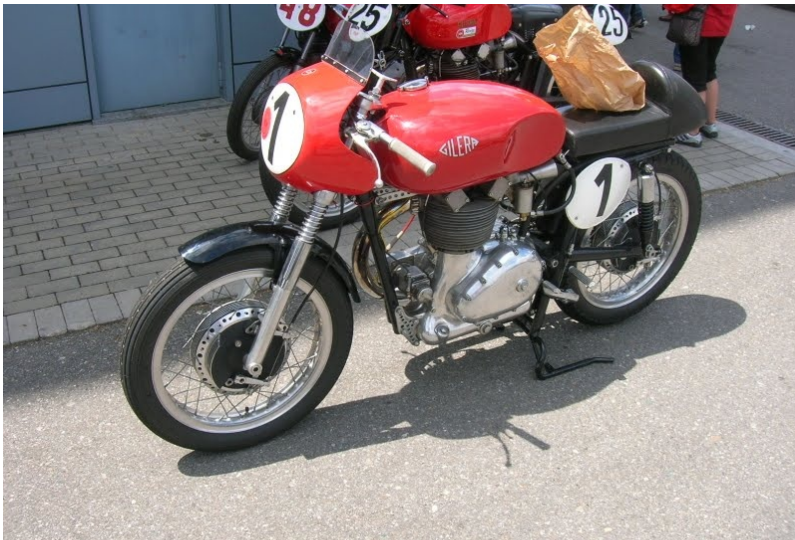
GILERA Saturno Piuma 1958?: 45cv pour les privés