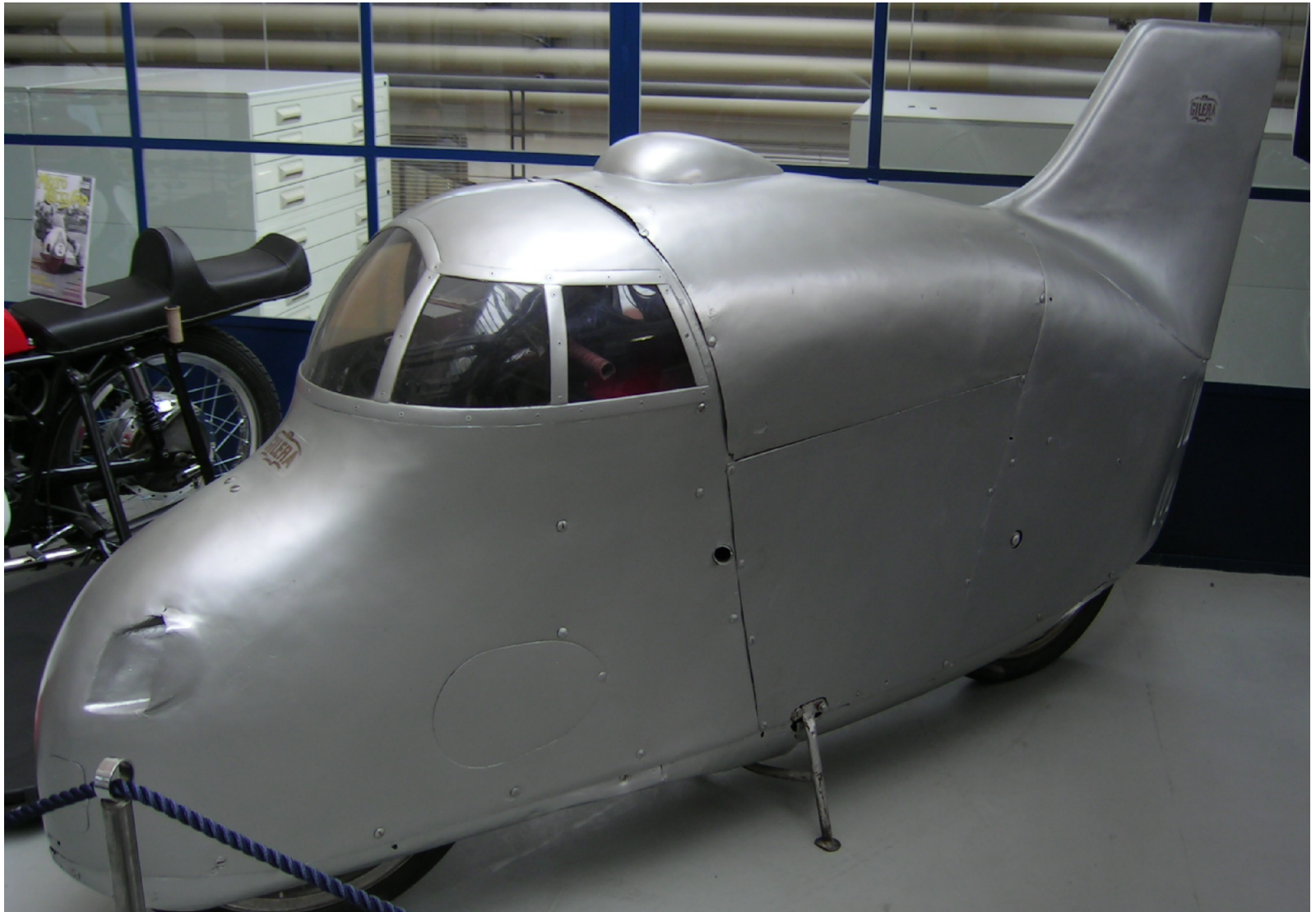
GILERA RONDINE 1937: 274.18 km/h