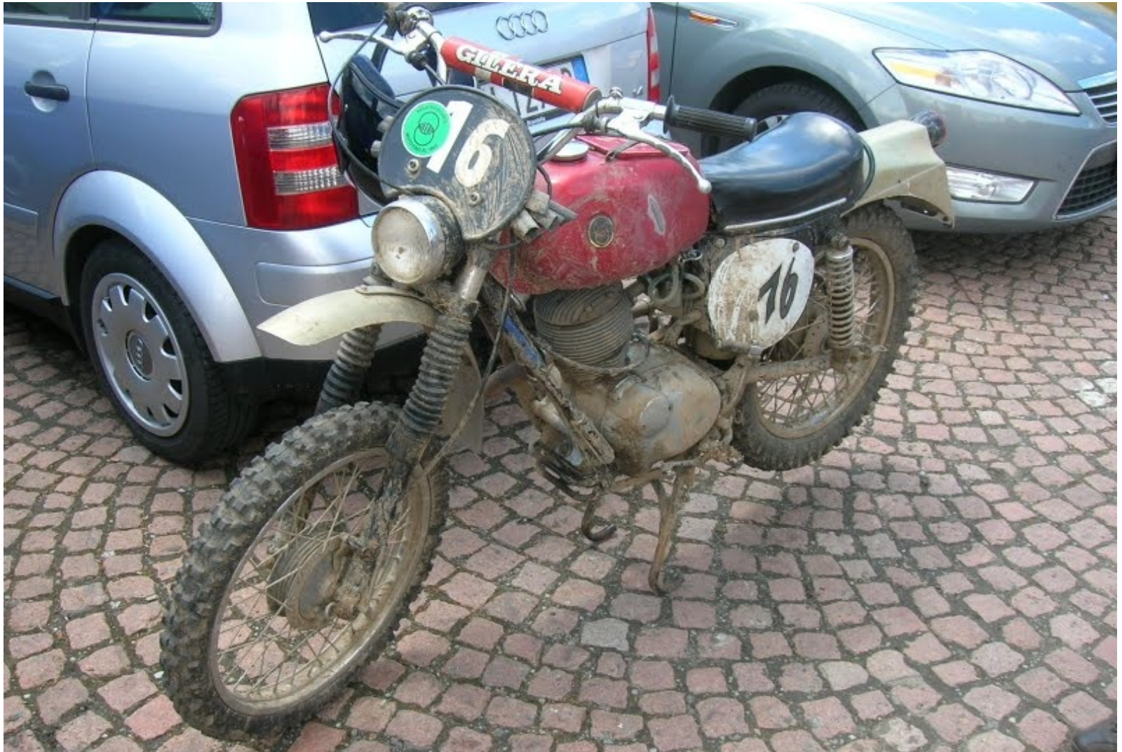
GILERA 175 Regolarità Competizione 1968: 13.5cv a 8000tr/min et 300km d'autonomie