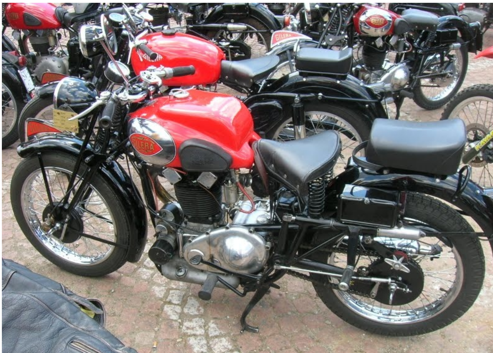
GILERA SATURNO SPORT 1948: 11 ans de succès sur route sur piste et en tout terrain