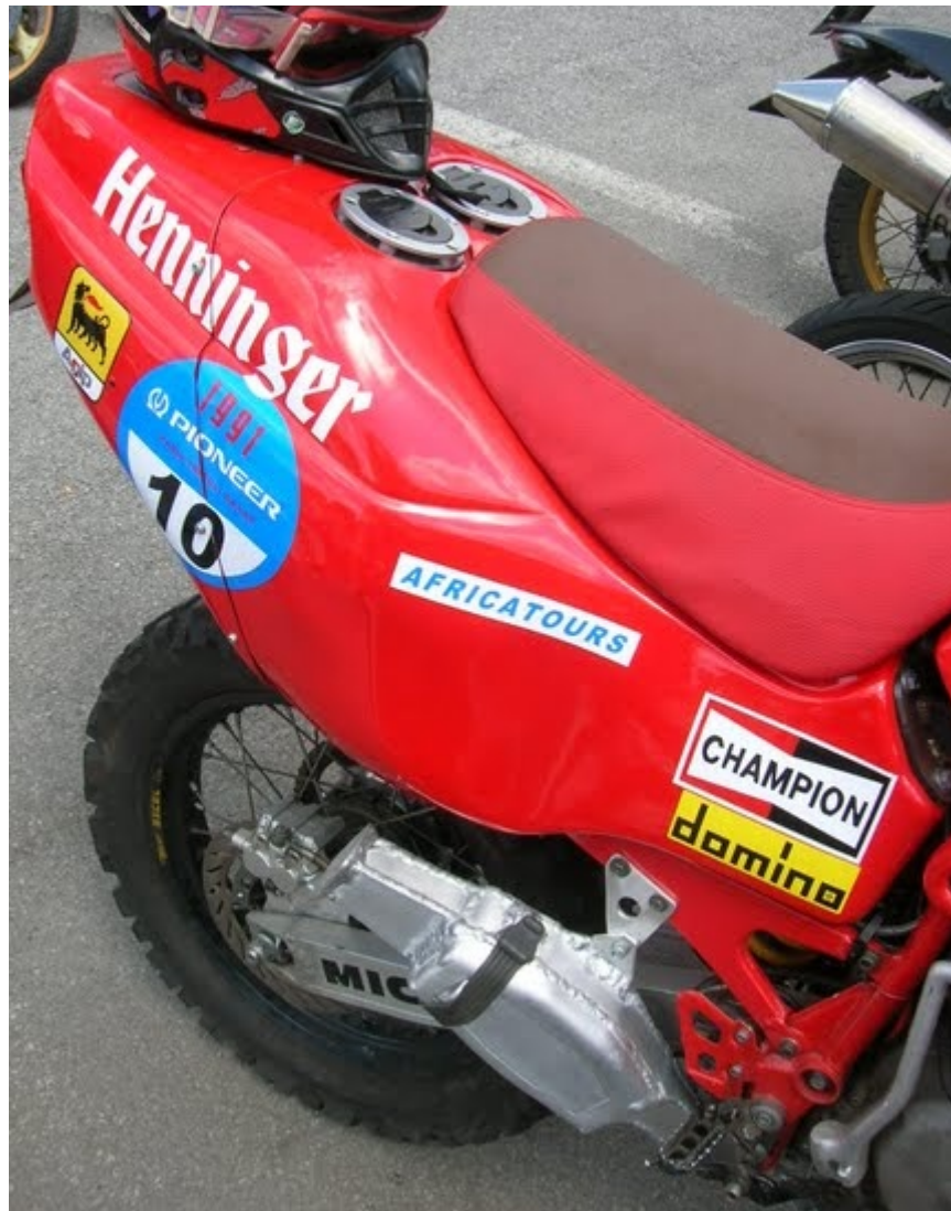
Détail de la GILERA 600 RC de Luigino MEDARDO vainqueur au DAKAR 1991.