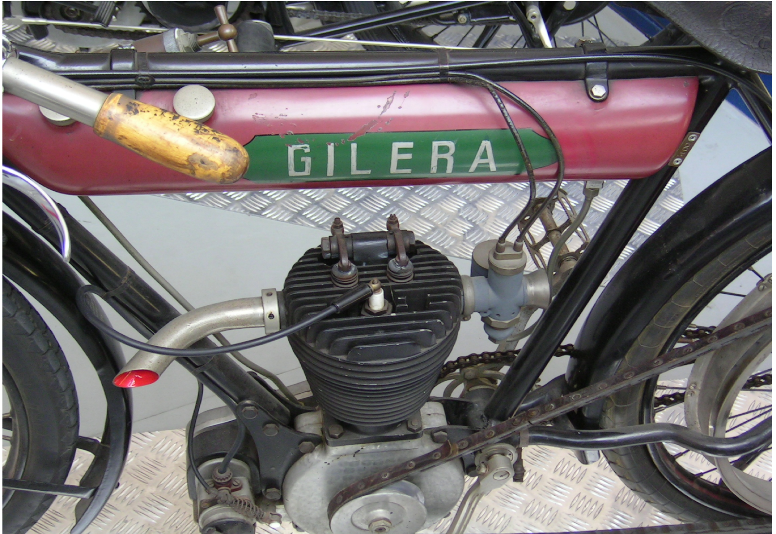
GILERA VT 317 1909 moteur culbuté