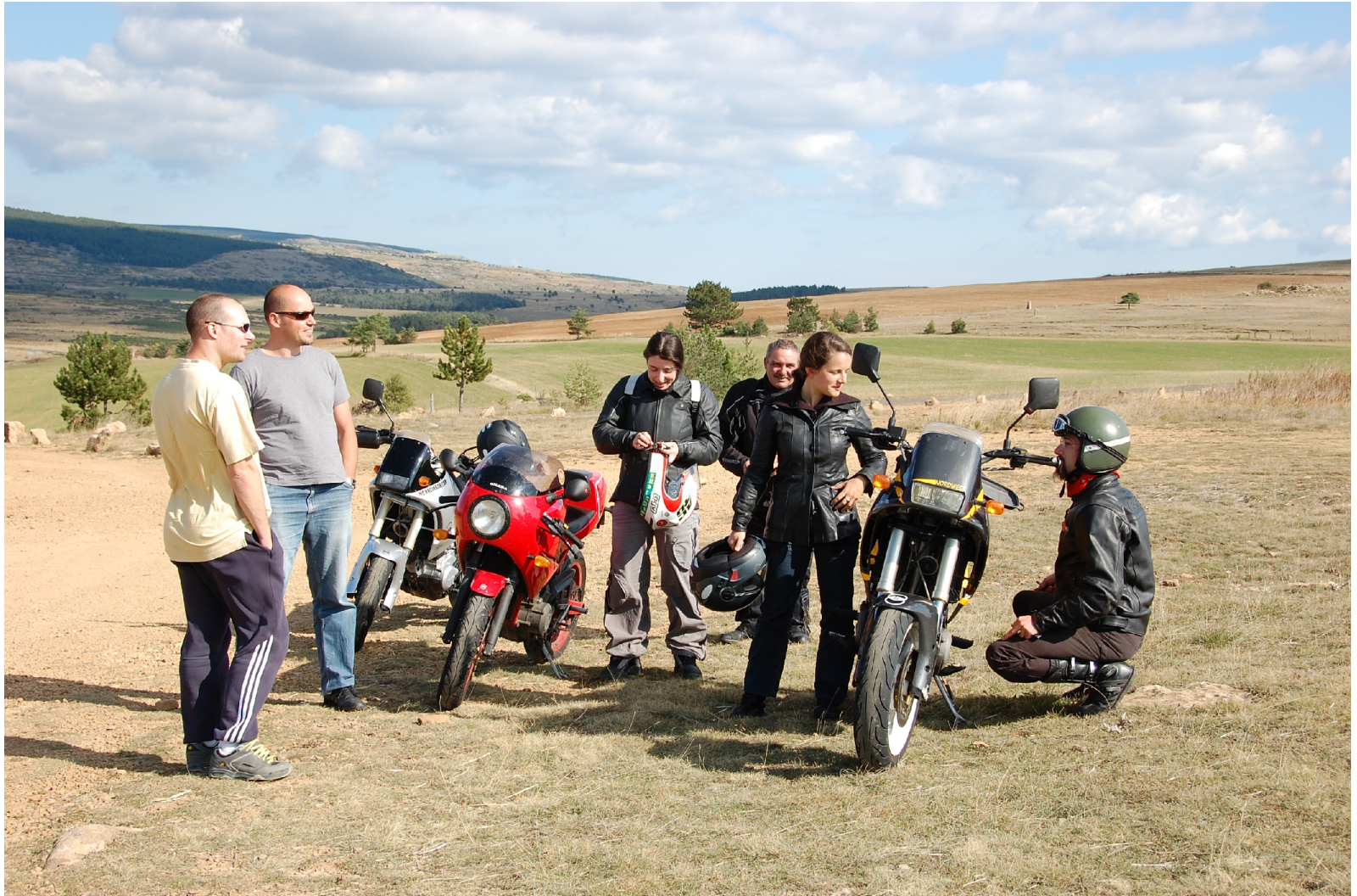
Formation Carbu en Lozère Septembre 2008