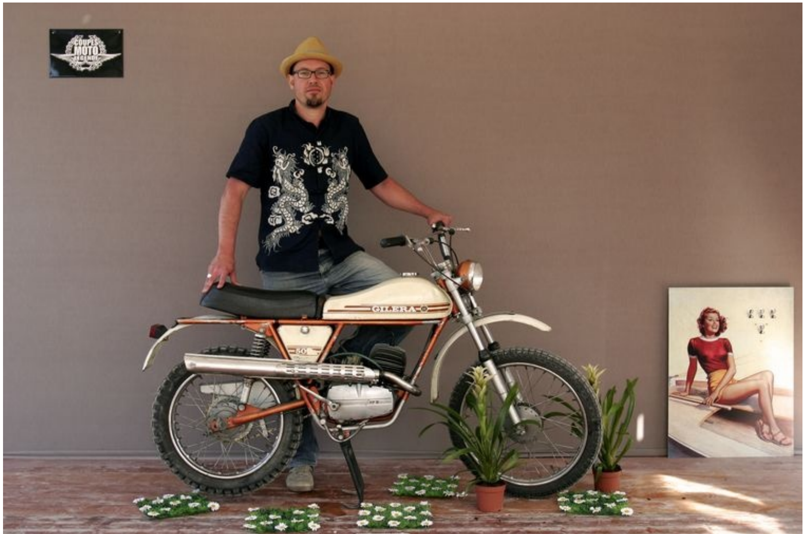
GILERA 5V TRIAL 1975 et Trésorier du GCF